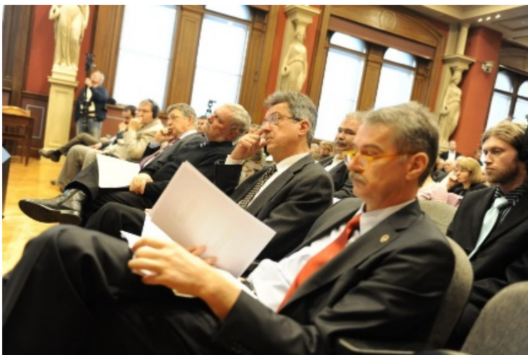
Hiányzott a "nemlétező munkacsoport" a keddi Bős-konferenciáról

„A Magyar Tudományos Akadémián korábban egy Szigetközi Munkacsoport is működött. A testület utolsó tisztújítása 2008-ban volt, 2011-ben viszont már nem választottak új tagokat. Az akadémiának tehát Szigetközi Munkacsoportja nincsen” – adta hírül közleményben az MTA, nem sokkal azután, hogy lapunkban megírtuk : a Duna elterelésének ökológiai következményeit és a lehetséges vízpótlási megoldásokat elemző akadémiai konferenciára érthetetlen okból nem hívták meg az említett munkacsoportot.